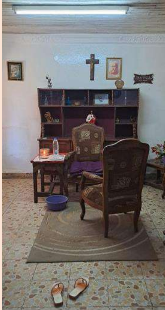
Source : Lieu de culte et objets sacrés : eau bénite, bougie allumée, portraits de Saint-Benoit, Sainte Marie, La croix,... Ambanidia, Antananarivo, Madagascar, janvier 2025