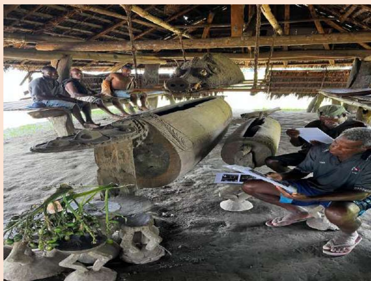
Source : Retour des archives visuelles et textuelles de Gregory Bateson assemblées lors d'un rituel d'initiation performé dans la maison des hommes de Kaminimbit en décembre 1932. Kaminimbit, Province du Sepik Oriental, Papouasie-Nouvelle-Guinée, août 2024

Mots-clés : Initiation, Changements religieux, Tourisme, Archives