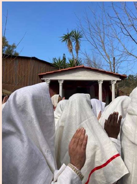
Source : La seconde photo a été prise en janvier 2024 à Rome, dans l'un des temples du groupe Pietas lors d'une cérémonie collective pour l'initiation de deux membres.© Néphélie SKARLATOS