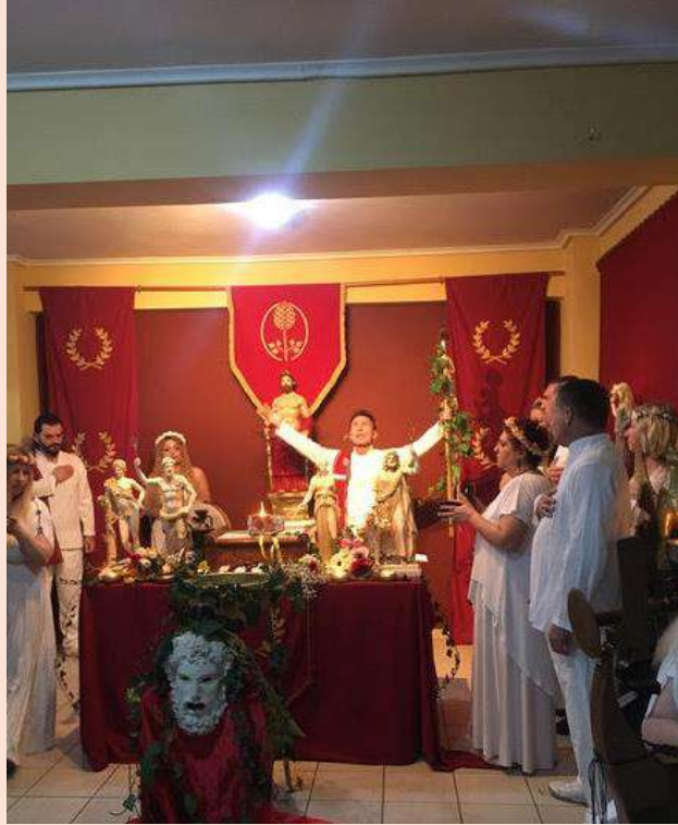
Source : Lors d'une cérémonie de l'YSEE (Conseil Suprême des Hellènes Ethniques) à Ekativolos, -leur temple officiel-, un appartement réaménagé du centre ville d'Athènes. La cérémonie célèbre le nouveau mois, selon le calendrier antique de l'Attique. 2022© Néphélie SKARLATOS