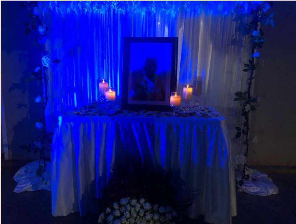
Source : Enterrement d'Edith, Kimironko, Kigali, Rwanda, Avril 2023 © SAMUEL LABBE

Mots-clés : Rituel, sorcellerie, parenté, Rwanda