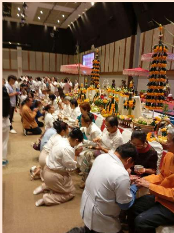
Source : Moment de l'onction des disciples ponctuant la cérémonie d'hommage aux maîtres (wai kru) de la médecine traditionnelle et du massage thaï, lors de l'événement de promotion culturelle "Lanna expo", à Chiang-Mai en juillet 2024.

Mots clés : massage thaï, bouddhisme, patrimoine, prospérité