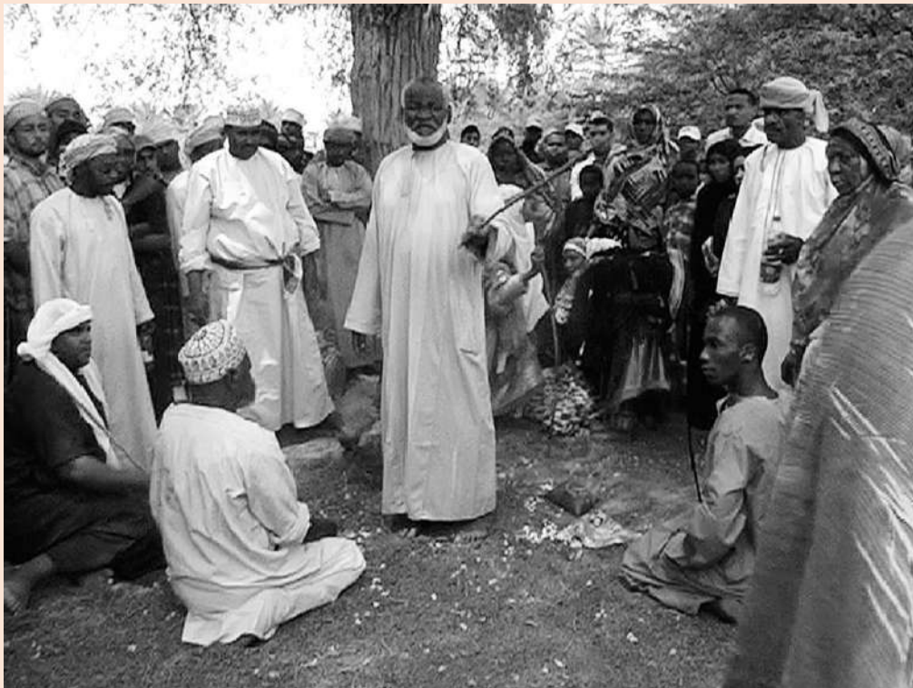
Source : Rite de possession leiwah au Sultanat d'Oman. Intervention de l'officiant rituel dans le cadre des interactions entre les esprits et l'assemblée rituelle.